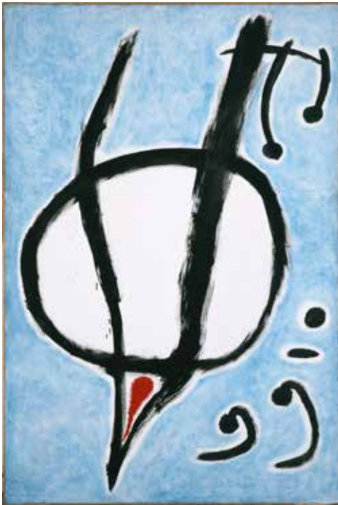
Joan Miró. Danseuse , 1969. Oli damunt tela. Dipòsit col·lecció particular