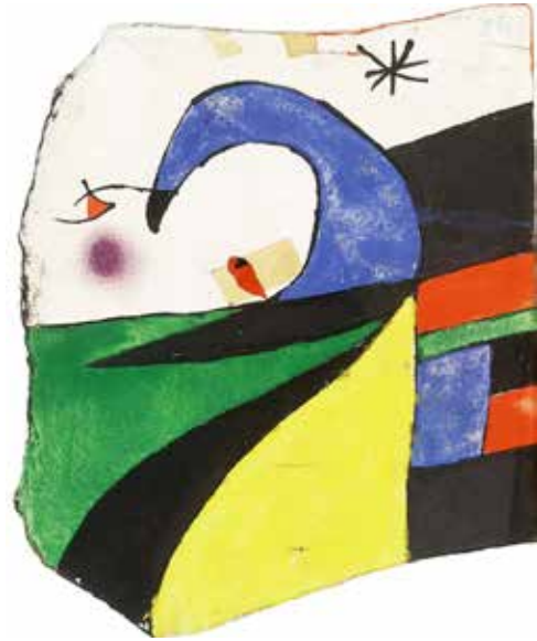
Joan Miró. Maqueta per a Gaudí I , c. 1975. Gouache, tinta, llapis de grafit, pastel i collage damunt paper