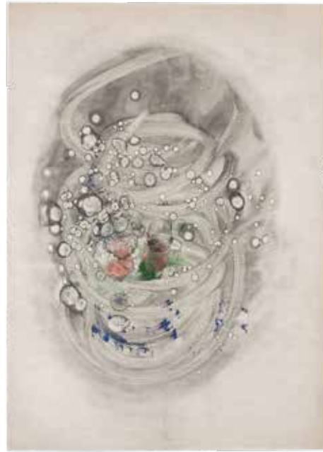
Joan Miró. Sense títol, sense data. Monotip damunt paper