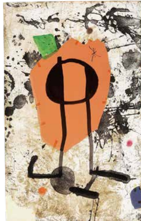
Joan Miró. Bon à tirer per a Fundació Palma II , 1978. Tinta, gouache, pastel, aigüafort i aigüatinta damunt paper