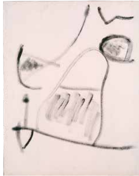
Joan Miró. L'éveil du matin , 1974 Oli damunt tela Dipòsit col·lecció particular

L'exposició finalitza amb una selecció de pintures acabades. A les darreres dècades de la seva vida Miró s'obsessiona amb uns pocs temes: dones, personatges, ocells i astres. No obstant això, el seu afany experimentador no desapareix, com ho palesen les seves pintures lacerades o foradades, de les quals es mostren diversos exemples de principis dels setanta. En aquesta època pintarà també damunt quadres comprats a mercats ambulants, com Personnages, oiseau, étoile, paysage de Palma (1973). Altres temes tractats per Miró són els paisatges, com a Paysage (1974), en què la terra és de color vermell, i L' Odeur de la prairie (1973), un paisatge replet de petits incidents pictòrics. També pinta ballarines, com Danseuse (1969), i aquest és un altre tema freqüent en la seva obra. Aquí veiem un cercle blanc central damunt un fons blau, que suggereix un ball nocturn durant una lluna plena. Una altra pintura destacable és L'éveil du matin (1974), sobre la sortida del sol. Miró explora de manera simultània el que té més pròxim en el món rural i els distants espais insondables del cosmos.