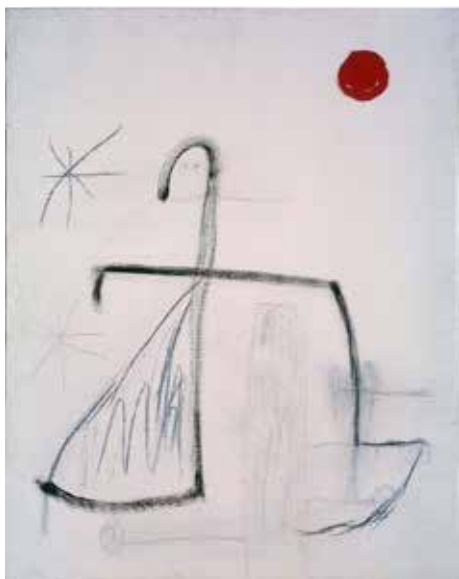
Joan Miró. Sense títol, 1978. Oli i carbonet damunt tela

Miró pintava damunt teles blanques i començava les seves composicions amb ràpids i expressius traços negres. La forma com s'apliquen sembla indicar que una taca o una línia suggeria la següent, i així successivament. Els colors s'hi afegien més tard. Entre les obres sense acabar s'ha volgut destacar un nombrós grup de pintures de petit format, que amb prou feines estan esbossades, devora una sola obra del mateix format i que podria estar acabada, per a poder reconstruir el seu procés de realització.