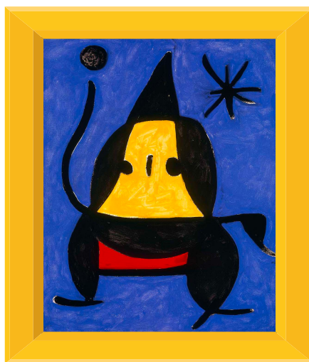
SIN TÍTULO, 1978