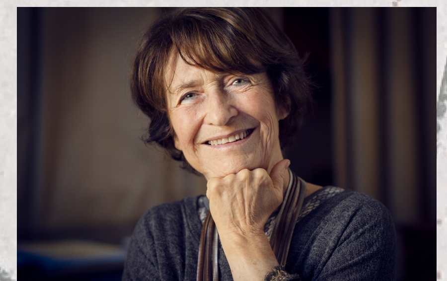
Graciane Finzi, compositora