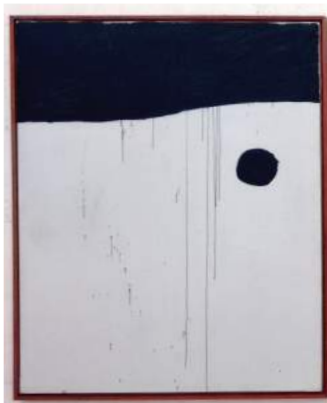
SENSE TÍTOL, 1973

COM JA US HEM EXPLICAT ABANS, LA PROPOSTA ES POT REALITZAR AMB DIFERENTS NIVELLS DE DIFICULTAT. NOSALTRES US PROPOSAM CREAR EL HAIKU A PARTIR DE 3 OBRES I 3 CITES DE JOAN MIRÓ, PERÒ HO PODEU REDUIR NOMÉS A 1 DE CADA.