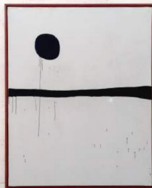
SIN TÍTULO, 1973