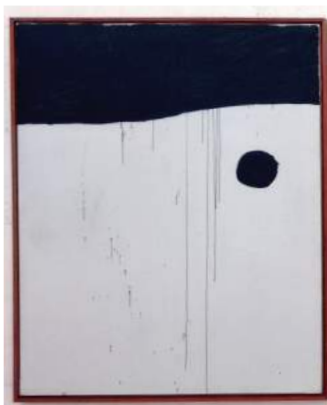
SIN TÍTULO, 1973

COMO YA OS HEMOS EXPLICADO ANTERIORMENTE, LA PROPUESTA SE PUEDE REALIZAR CON DIFERENTES NIVELES DE DIFICULTAD. NOSOTROS OS PROPONEMOS CREAR EL HAIKU A PARTIR DE 3 OBRAS DE ARTE Y 3 CITAS, PERO LO PODÉIS REDUCIR SÓLO A 1 DE CADA.