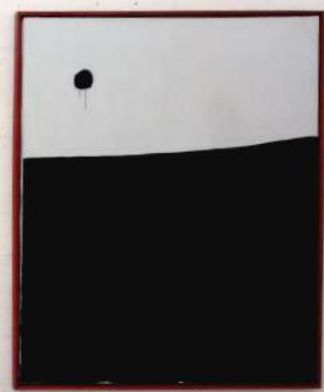
SIN TÍTULO, 1973