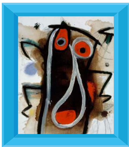
SENSE TÍTOL, 1977