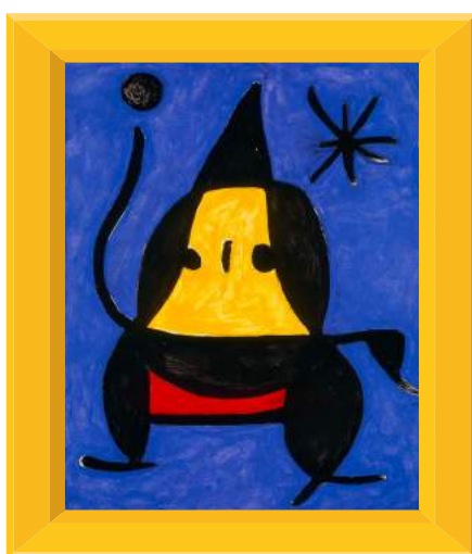
SENSE TÍTOL, 1978