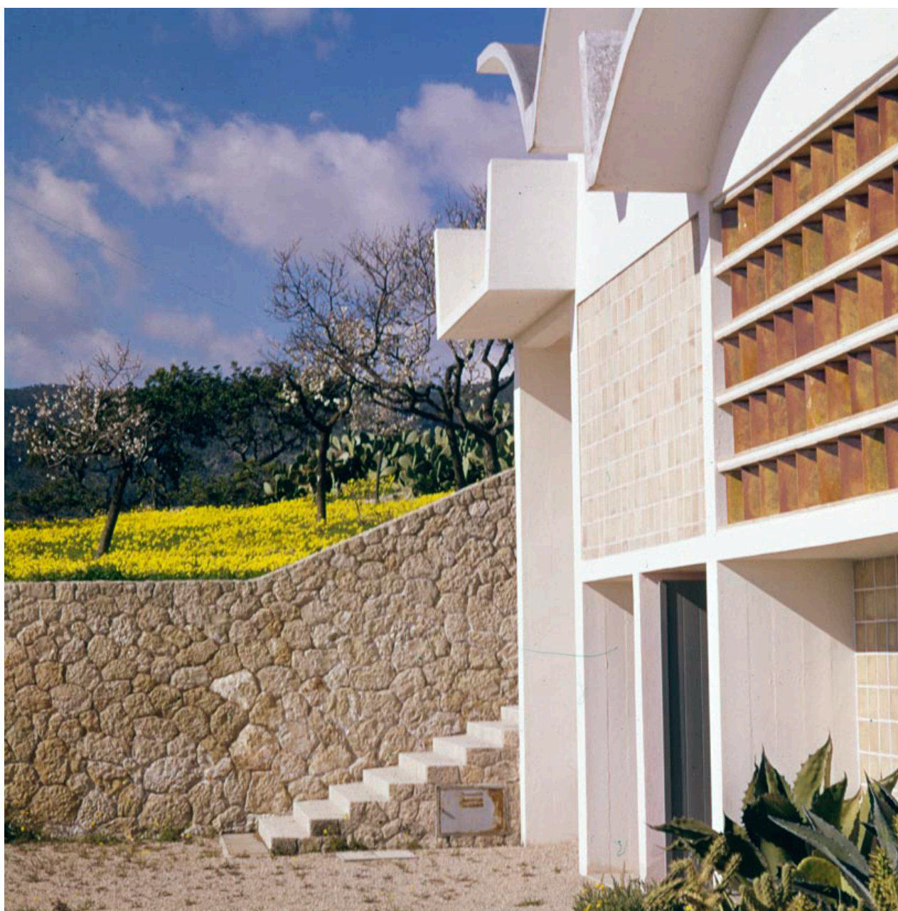
Taller de Miró a Mallorca, projectat per Josep Lluís Sert i construït el 1956. Fotografia de Joaquim Gomis (1961)

projecte expositiu, pictòric i audiovisual