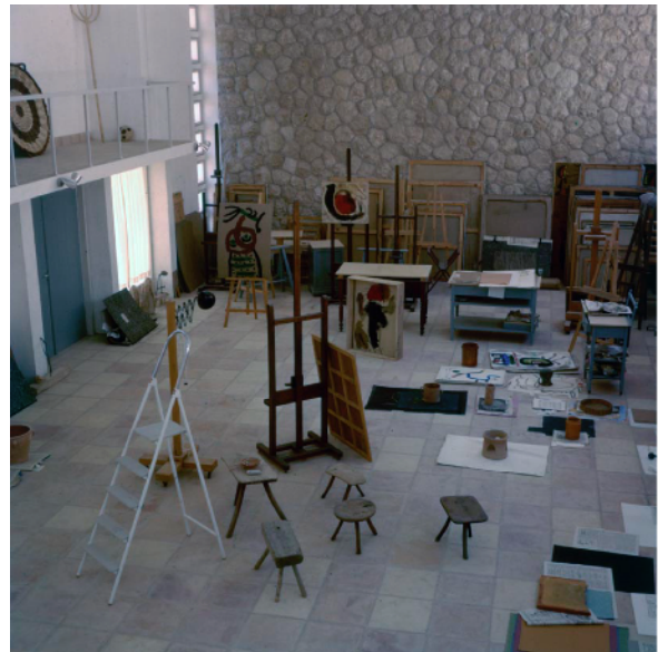
Fotografías de Joaquim Gomis (1961)