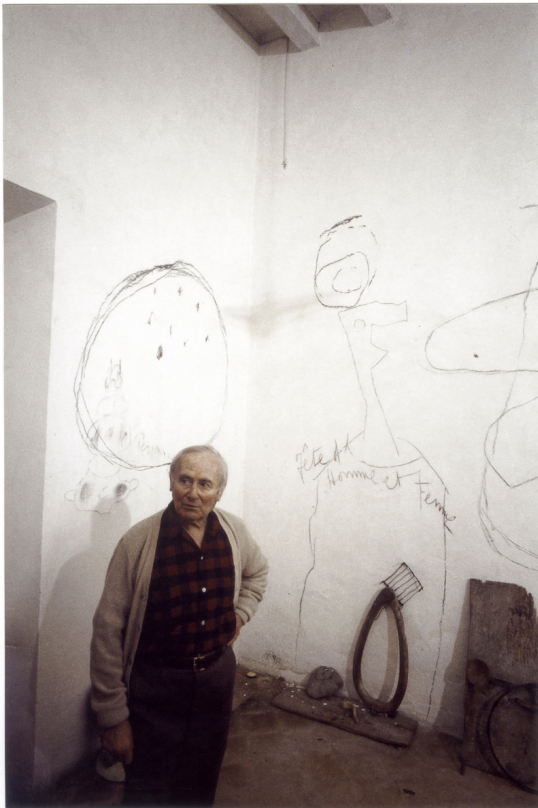
Joan Miró a Son Boter amb el grafit relacionat amb Constellation , 1973