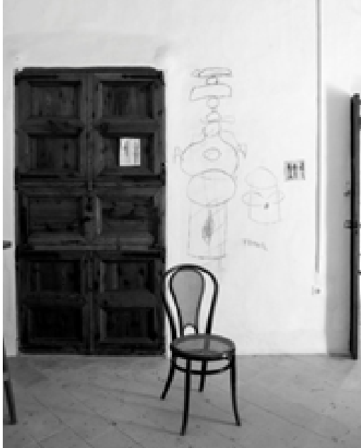
Grafit de Joan Miró a les parets de Son Boter, 2014

com grafits gràfics, banals i anònims del carrer