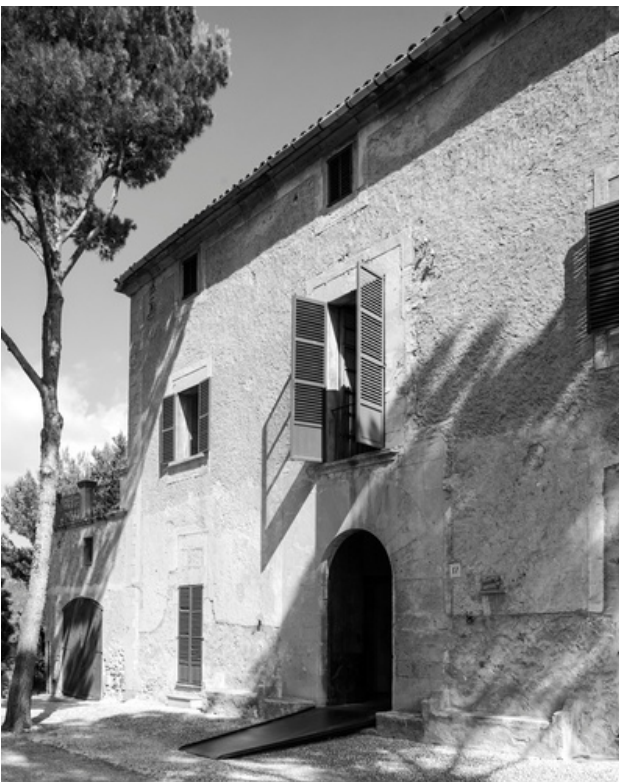
Son Boter, 2014 © Jean Marie del Moral

Destinat inicialment a taller d'escultura, Son Boter passa a ser el seu segon estudi de pintura i un lloc de refugi. Anys més tard, la possessió albergarà també uns tallers de gravat i litografia que permetran a Miró la realització d'obra gràfica sense sortir dels seus estudis. Aquests tallers actualment romanen oberts per a la creació artística i les edicions gràfiques, i són el principal llegat de Miró per tal que la Fundació de Mallorca sigui un centre viu i dinàmic.