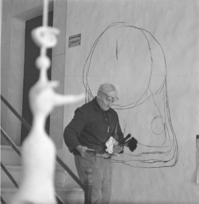
Joan Miró a Son Boter amb el guix de l'escultura Projet pour un monument , 1967

arènyer el concepte monumental i arquitectònic