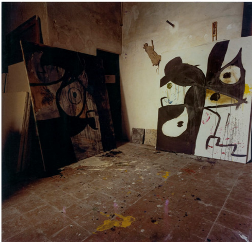
Femme, oiseau en cours a Son Boter, 1973