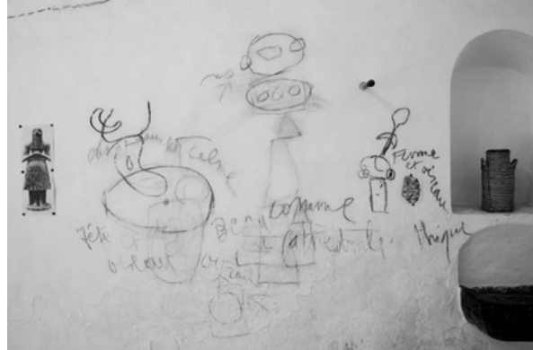
Son Boter, 2012