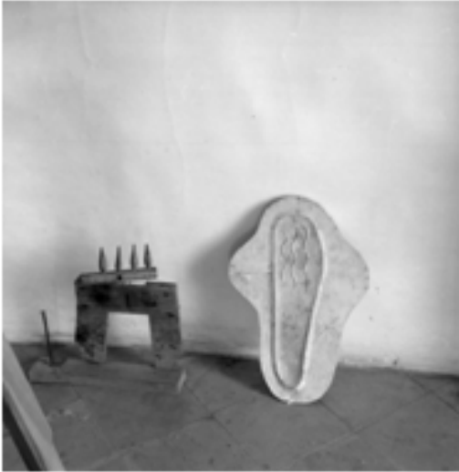
Maqueta de l'escultura Jeune fille i motlle de guix per a l'escultura Femme dans la nuit a Son Boter, 1961

servi-me de les coses Trobades pel diví afar