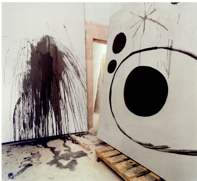
L'Oiseau s'envole vers l'île déserte en curs a Son Boter, 1973

En servirà per a fer-hi teles i escultures monumentals