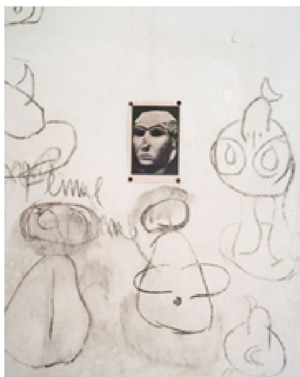
Grafitis de Joan Miró als murs de Son Boter, 2012