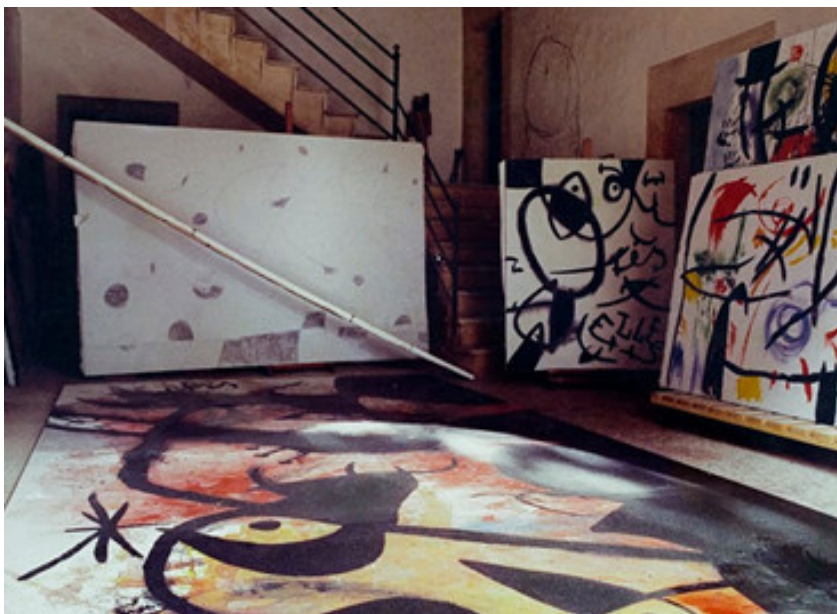
Pintures en curs a Son Boter, 1973