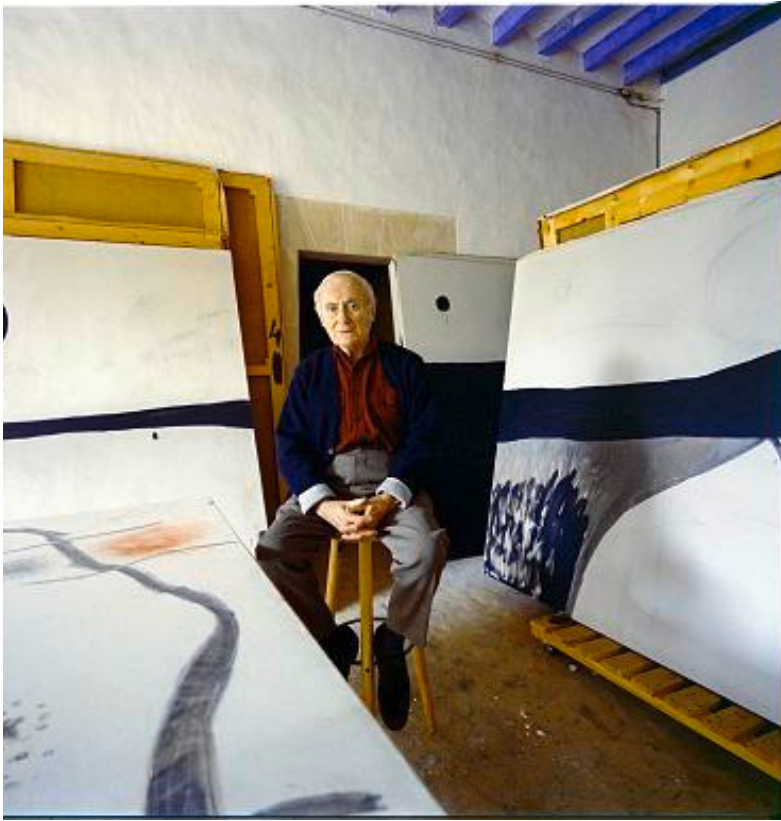
Joan Miró a Son Boter, 1973

Le retour à l'enfance et la naissance d'un nouveau monde