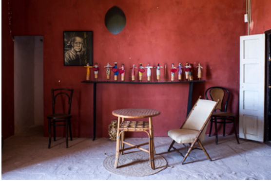
Habitació del pis superior de Son Boter, 2014