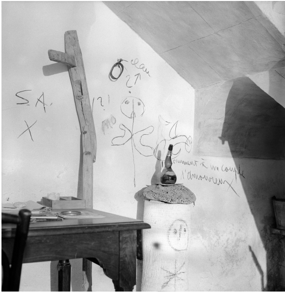
Objectes preparatoris per a Homme et femme a Son Boter, 1973

ho localitzaré tot a "Son Boter" per anar-ho treballant