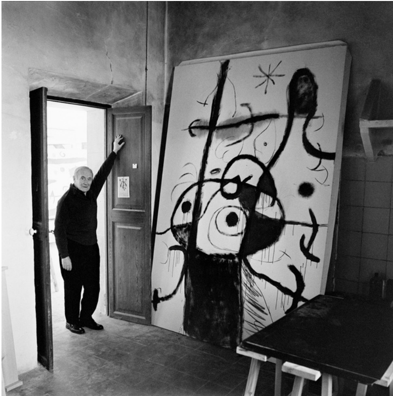
Joan Miró a la cuina de Son Boter amb la pintura Poème en procés , 1966