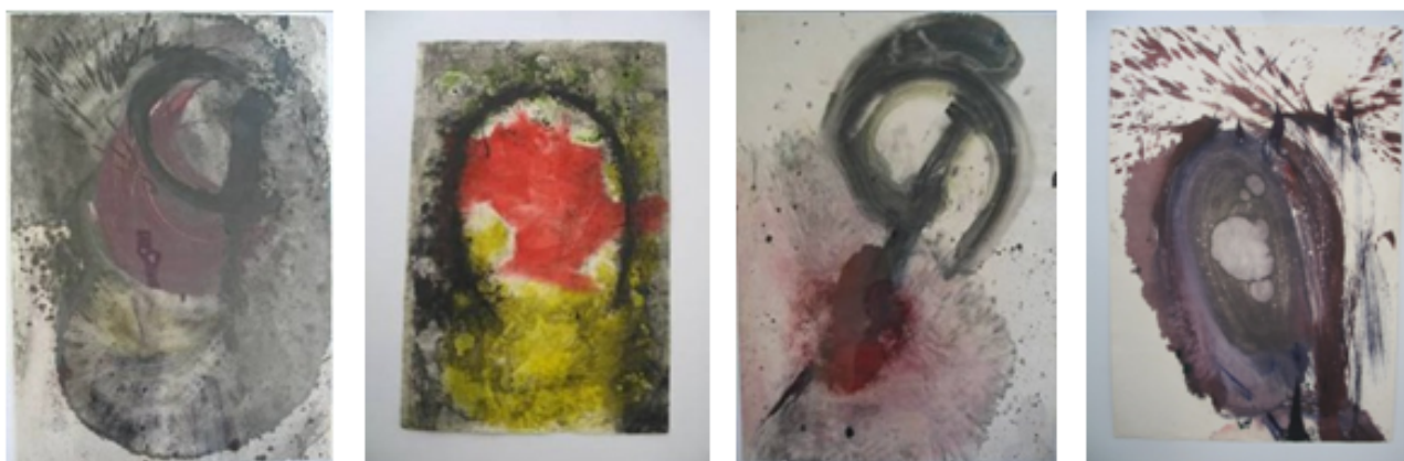
Joan Miró Sense títol, sense data Monotip damunt paper Fundació Pilar i Joan Miró a Mallorca