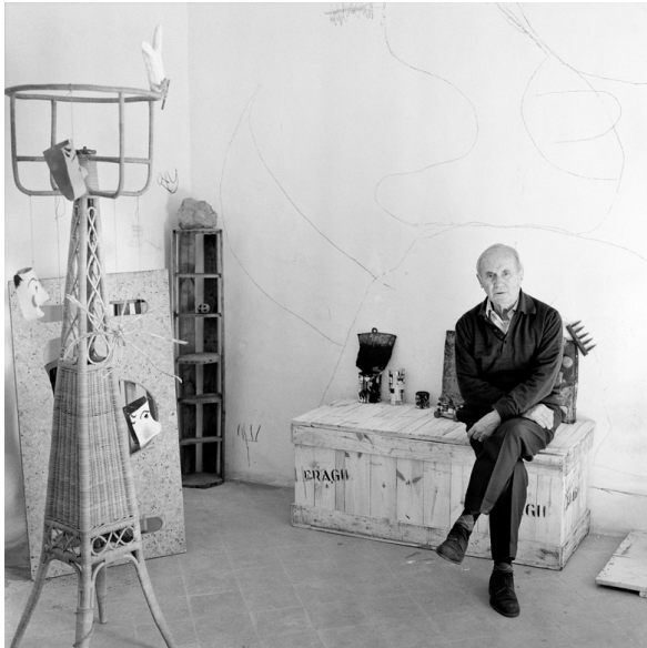
Joan Miró a Son Boter amb els objectes preparatoris per a l'escultura Souvenir de la Tour Eiffel , 1966

monstres vivents que viuen en el taller - mon i part