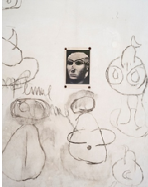
Grafit de Joan Miró a les parets de Son Boter, 2012