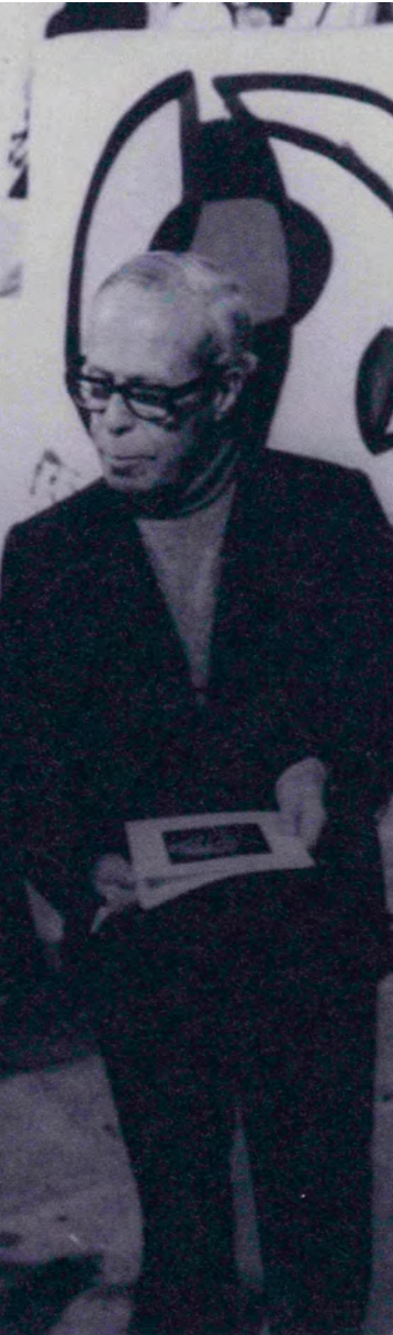
Joan Miró treballant al Taller Sert, 1960