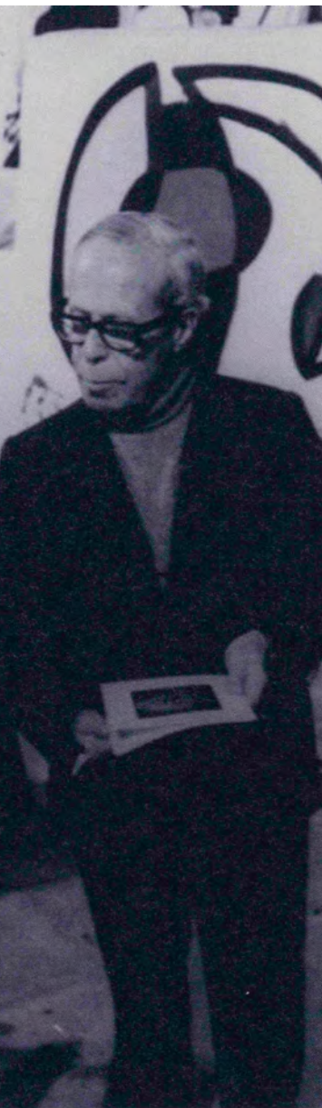
Joan Miró trabajando en el Taller Sert, 1960