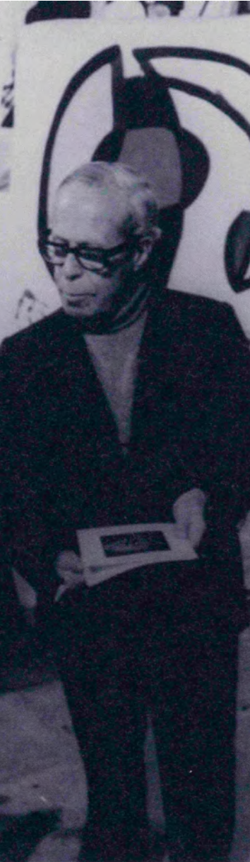
Joan Miró au travail dans l'atelier Sert, 1960