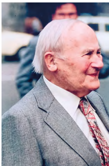
Joan Miró et Pilar Juncosa, 1982

Majorque lui permet de recommencer à nouveau. Dans ses dernières années, son activité prend alors un rythme frénétique. C'est là que commence le véritable Miró et ce sera aussi la dernière étape creative de l'artiste.