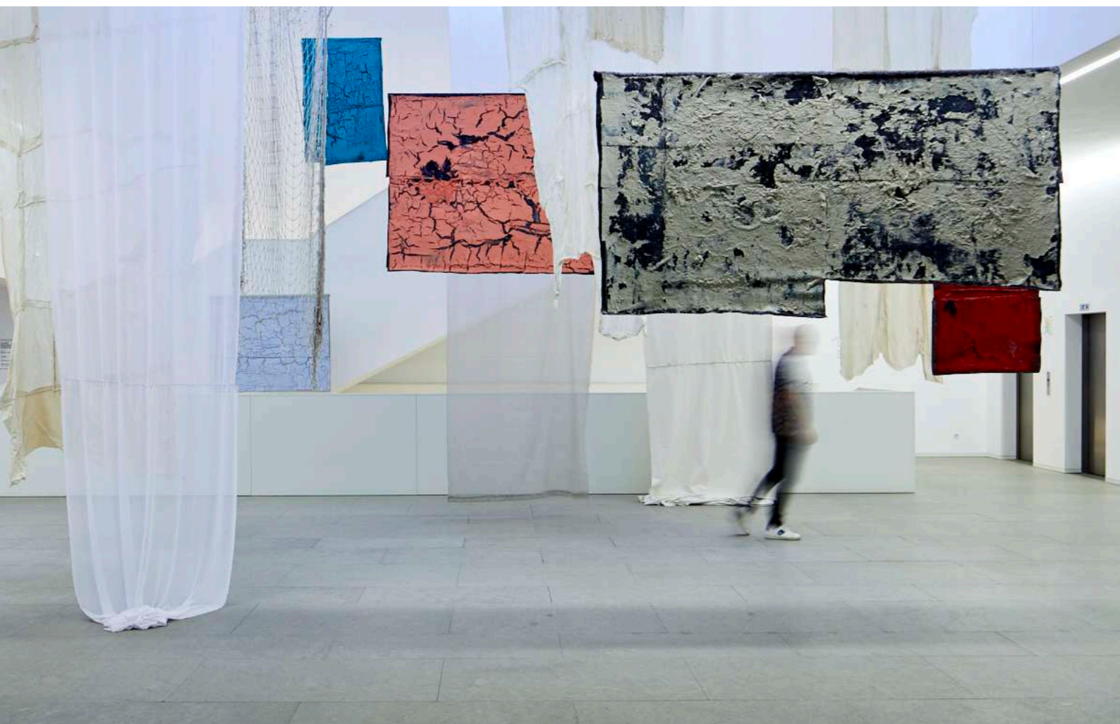
Polychromatic Environment, 2019 Instal·lació. CIAJG, Guimarães

El fuego también tiene usos rituales, como en las ceremonias de Pascua de las comunidades yaquis y, más cerca, la celebración de la noche de San Juan. En una ocasión, Carlos Bunga presentó una ceremonia de Pascua yaqui en Arizona, donde las máscaras de demonio –hechas a mano cuidadosamente el año anterior– se queman al final de la ceremonia, de modo que, para la celebración del año siguiente, deben fabricarse máscaras nuevas. Esa experiencia e imágenes tan potentes arraigaron en el cerebro de Bunga como una semilla que permanece dormida debajo de las cenizas después de un incendio forestal hasta que llega el momento de eclosionar. Si un plantón se nutre y alimenta, puede fructificar. Y así lo hizo en el caso de Bunga, impregnando su proyecto para la Fundación Miró Mallorca, cuyo periodo expositivo coincide con la fiesta de San Juan. La verbena de San Juan, el 23 de junio, se alinea con el solsticio de verano, el día más largo del año y la noche más corta. Durante siglos, las sociedades agrarias marcaron este momento con rituales con fuego para dar la bienvenida al verano, asegurar cosechas abundantes, promover la fertilidad y alejar los malos espíritus. También se creía que el fuego purificaba y fortalecía la fuerza del Sol.