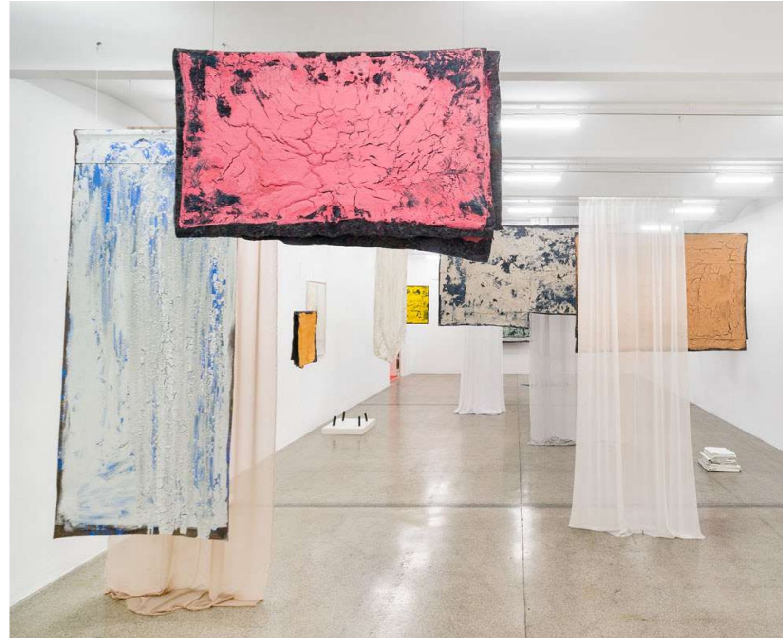
Mind Awake, Body Asleep , 2021