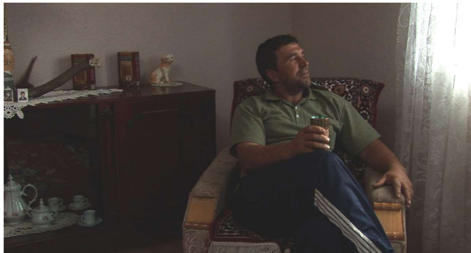
A lo mejor , 2007 Película, 16:9, 13' color