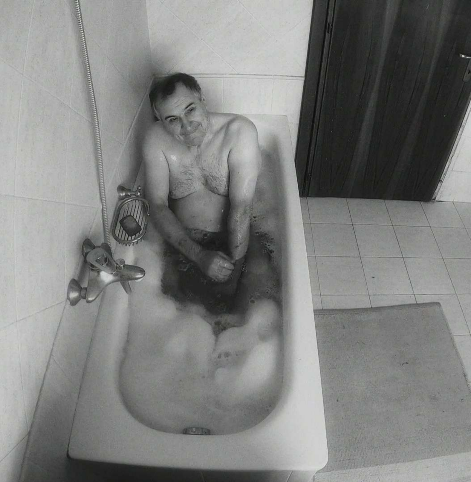
La montaña mágica , 2023 Documental, 16:9, 102', B/N