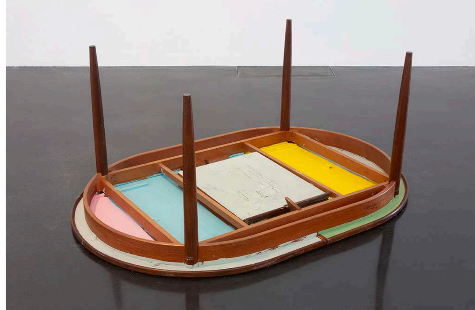
Animism #17, 2024 The New Art Gallery Walsall @Jonathan Shaw